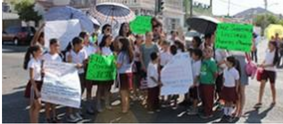
Reclaman posponer clases por contaminación de río en Sonora

la seguridad, el tema del crecimiento económico para traer más inversión y generar más empleos”, señaló.