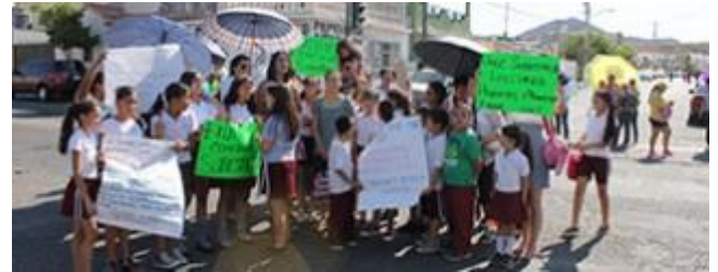
Reclaman posponer clases por contaminación de río en Sonora