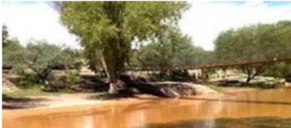
Acciones de Grupo México caen tras denuncia por derrame químico