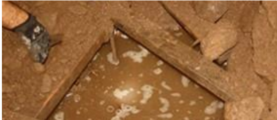
Descubren narcotúnel equipado y droga entre Sonora y Arizona