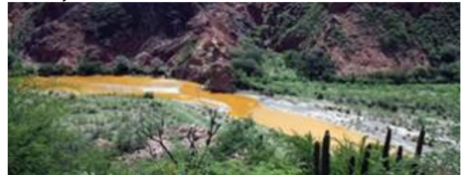
Supervisa Segob reparación de daños tras derrame en Sonora