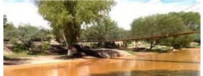
Acciones de Grupo México caen tras denuncia por derrame químico