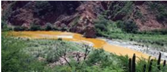
Supervisa Segob reparación de daños tras derrame en Sonora