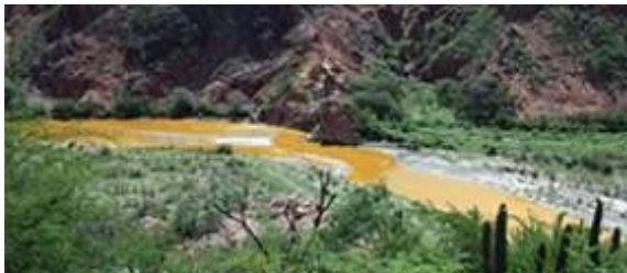
Este viernes se entregarán resultados de contaminación en río Sonora