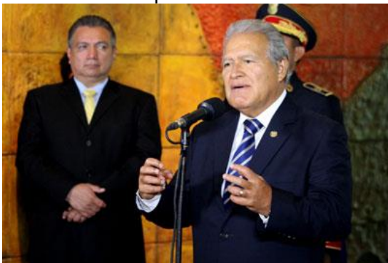
Presidente Salvador Sánchez Cerén pide a diputados acelerar aprobación de la Ley General de Agua.

El presidente Salvador Sánchez Cerén pidió, este lunes, a los partidos políticos representados en la Asamblea Legislativa, agilizar la aprobación a la Ley General de Aguas, actualmente estancada por la derecha.