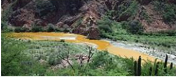
Este viernes se entregarán resultados de contaminación en río Sonora