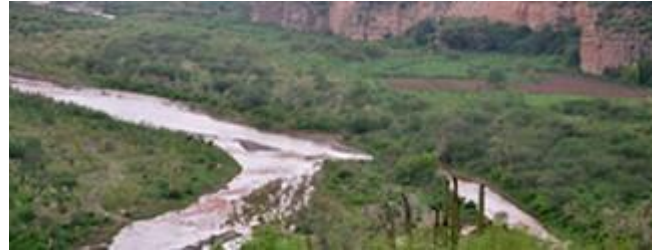
Denuncia la Profepa a Minera México por derrame a Río Sonora