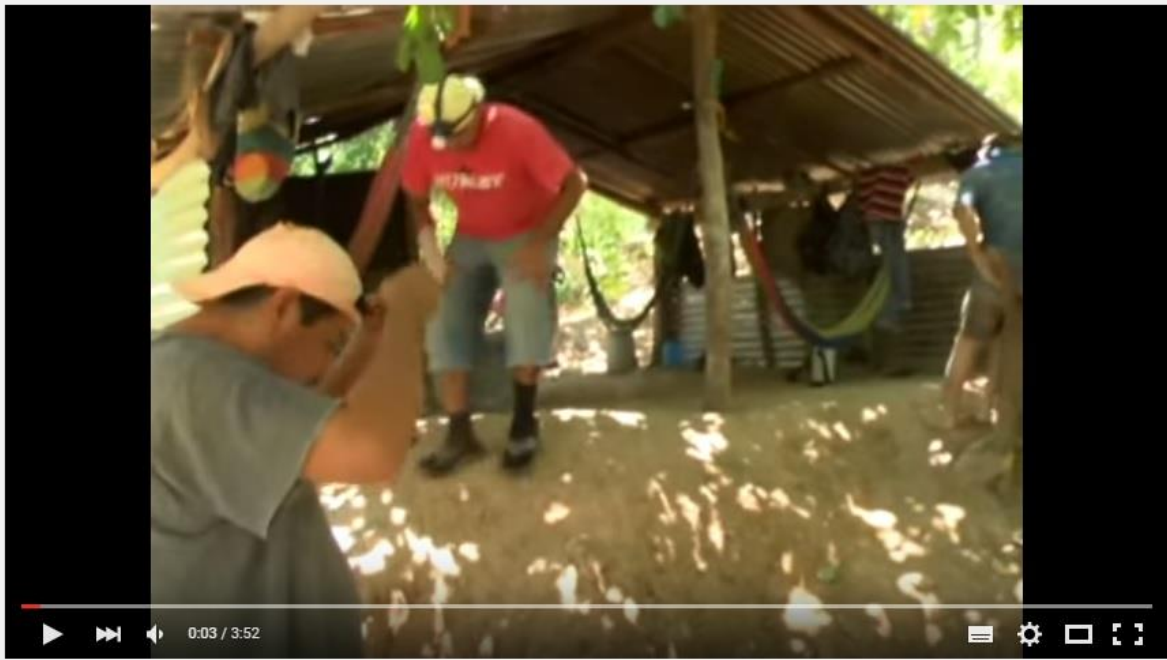
LOS EFECTOS DE LA MINERÍA EN SANTA ROSA DE LIMA

https://www.youtube.com/watch?v=G72TGYaSQes&feature=youtu.be