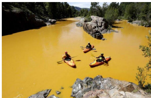
El río Ánimas, en Colorado, teñido de amarillo por un enorme derrame tóxico.

Una tragedia medioambiental ha golpeado severamente a una tranquila y hasta hace poco idílica región de Colorado, luego de que más de un millón de galones de aguas tóxicas y ácidas –cargadas además con residuos de minerales pesados- fueron derramadas por error de una mina abandonada.