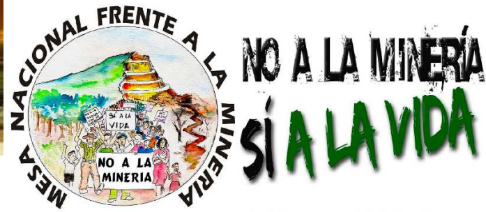
Mesa Nacional frente a la Minería en El Salvador

NO A LA MINERÍA EL SALVADOR CENTROAMÉRICA