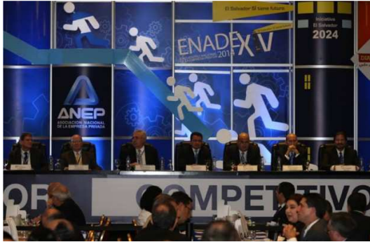
Directivos de la ANEP en inauguración del ENADE 2014.

Según el último documento de ENADE 2014, el anteproyecto de ley de Soberanía y Seguridad Alimentaria y Nutricional, que está en la Asamblea Legislativa, violenta el derecho a la libertad de expresión, porque como una medida de protección de política nutricional intentará regular la publicidad de comidas dañinas a la salud.